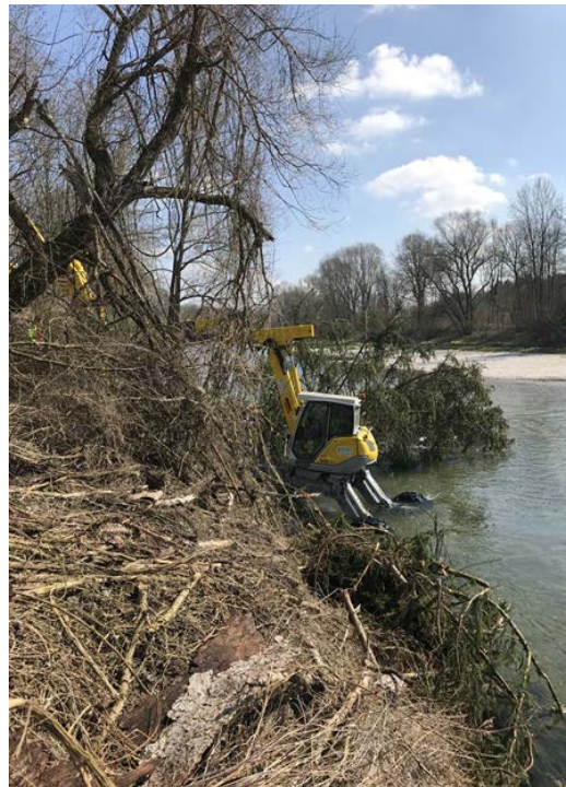
Platzieren der Fichte